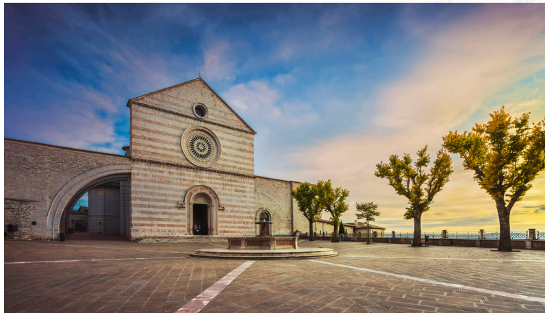
Basilica de Santa Clara, Asís