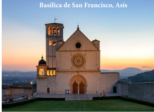
Basilica de San Francisco, Asís