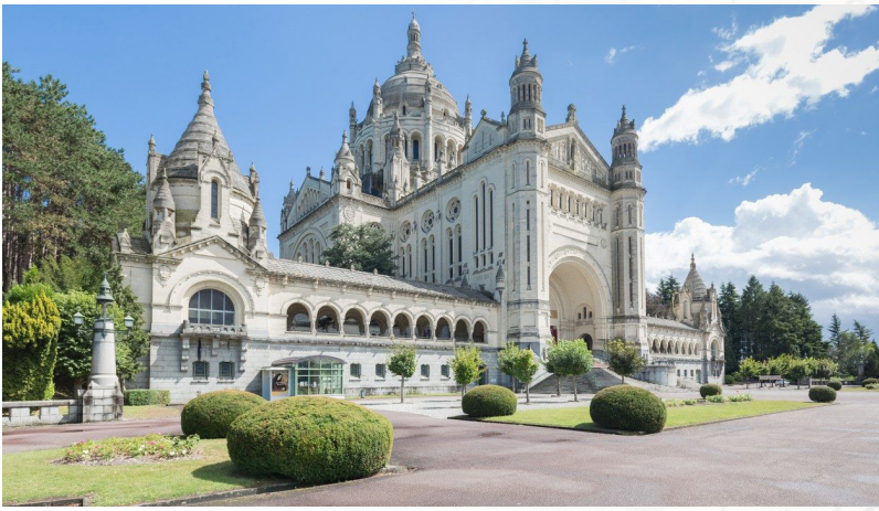
Basilica de Santa Teresa, Lisieux