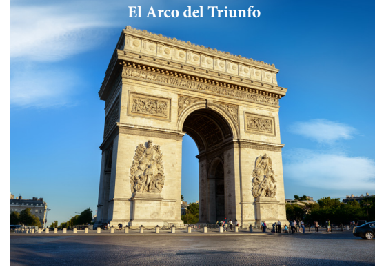
El Arco del Triunfo