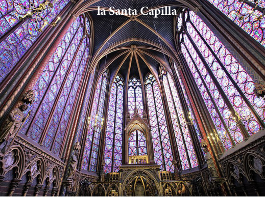
la Santa Capilla