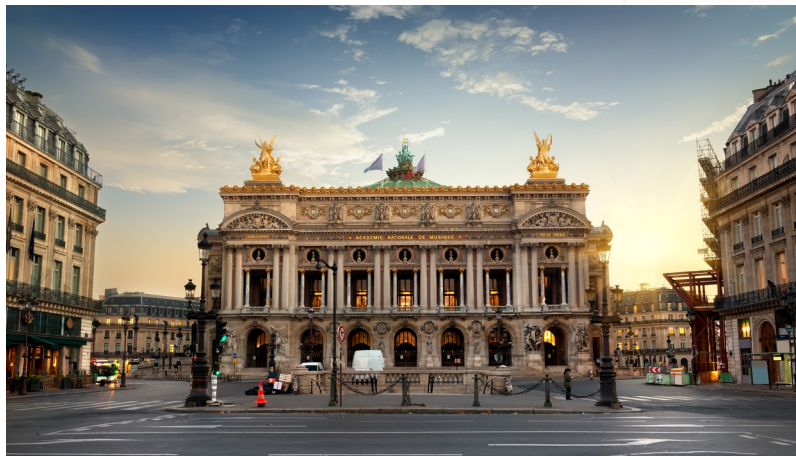
Ópera de París